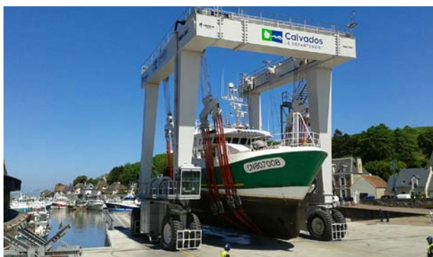
L'élévateur à bateaux a été cofinancé par le Département, la CCI et les fonds européens du FEDER