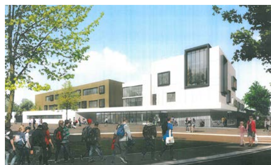
Le futur collège Gisèle Guillemot à Mondeville

E-tude, plate-forme numérique d'aide aux devoirs